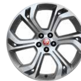
JANTES 20" 6 BRANCHES DOUBLES 'STYLE 6014' FINITION SATIN GREY DIAMOND TURNED

À l'intérieur, on retrouve des sièges en cuir Windsor Ebony avec double surpiqûre contrastée Flame Red et des tapis de sol exclusifs à la Première Édition. On y trouve également une garniture de pavillon en suédine, ainsi qu'un système d'affichage tête haute monté en série.