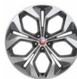
JANTES 21" 5 BRANCHES DOUBLES 'STYLE 5053' SATIN GREY DIAMOND TURNED