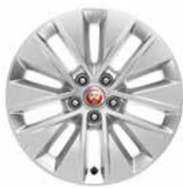
JANTES 17" 10 BRANCHES 'STYLE 1037'