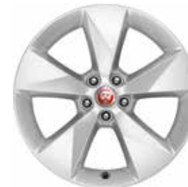
JANTES 18" 5 BRANCHES 'STYLE 5048' De série sur E-PACE R-Dynamic S