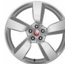
JANTES 19" 5 BRANCHES 'STYLE 5049' De série sur E-PACE R-Dynamic SE