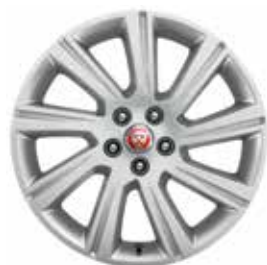
JANTES 18" 9 BRANCHES 'STYLE 9008' De série sur E-PACE S