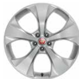
JANTES 20" 5 BRANCHES 'STYLE 5054' De série sur E-PACE HSE