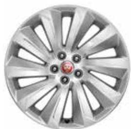
JANTES 19" 10 BRANCHES 'STYLE 1039' De série sur E-PACE SE