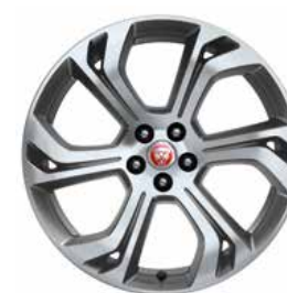
JANTES 20'' 6 DOUBLE-BRANCHES 'STYLE 6014' FINITION SATIN GREY DIAMOND TURNED