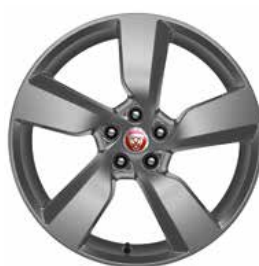
JANTES 19'' 10 BRANCHES 'STYLE 5049' SATIN DARK GREY