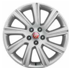
JANTES 18" 9 BRANCHES 'STYLE 9008' De série sur E-PACE S