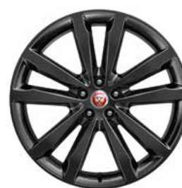
JANTES 20'' 5 BRANCHES DOUBLES 'STYLE 5051' GLOSS BLACK