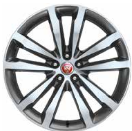
JANTES 20'' 5 BRANCHES DOUBLES 'STYLE 5051' SATIN GREY DIAMOND TURNED De série sur E-PACE R-Dynamic HSE