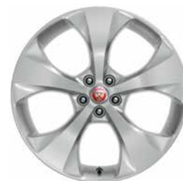
JANTES 20" 5 BRANCHES 'STYLE 5054' De série sur E-PACE HSE