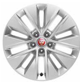
JANTES 17'' 10 BRANCHES 'STYLE 1037'