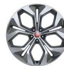
JANTES 21'' 5 BRANCHES DOUBLES 'STYLE 5053' SATIN GREY DIAMOND TURNED