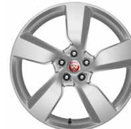
JANTES 19" 5 BRANCHES 'STYLE 5049' De série sur E-PACE R-Dynamic SE