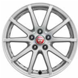
JANTES 17" 10 BRANCHES 'STYLE 1005' De série sur E-PACE et E-PACE R-Dynamic