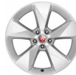
JANTES 18" 5 BRANCHES 'STYLE 5048' De série sur E-PACE R-Dynamic S