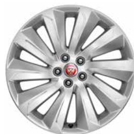
JANTES 19" 10 BRANCHES 'STYLE 1039' De série sur E-PACE SE